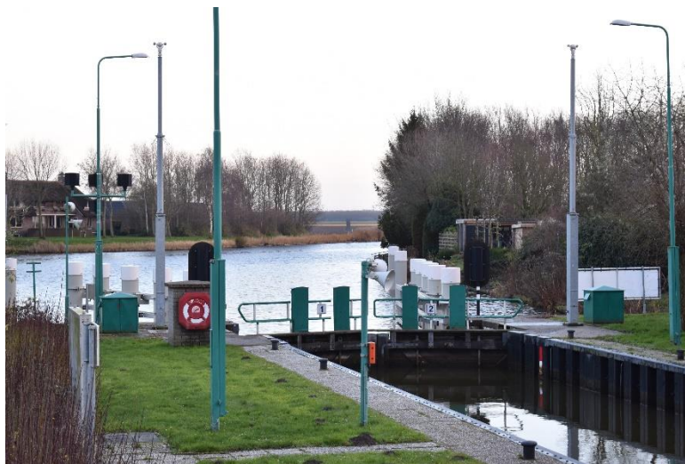
Sluis te Marknesse, Zwolse Vaart (tegenover pastorie)