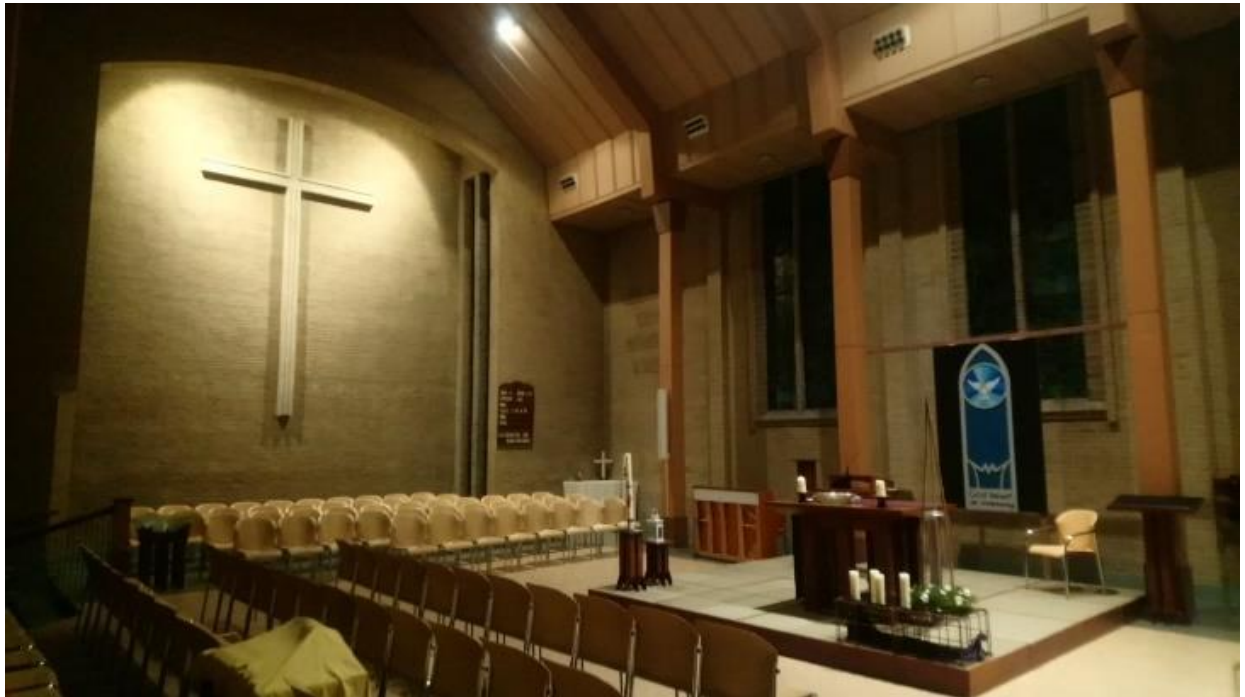
Interieur van de kerk, advent 2019

Als gemeente met elkaar met het geloof bezig willen zijn en blijven, om te groeien als gemeente van Christus hier op aarde, gericht op God, op de mensen en de wereld om ons heen, voor nu en voor de toekomst.